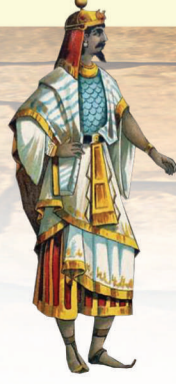
Radamés (líder de las tropas egipcias)