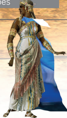
Aída (princesa y esclava de los egipcios)